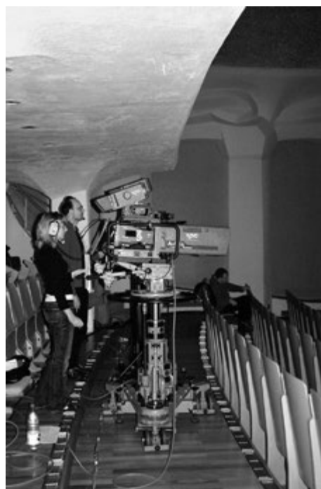
Schweizer Fernsehen und Emmentaler Liebhaberbühne im Rüttihubelbad

Das Rüttihubelbad weiterpflegen im Bewusstsein, dass es ein besonderer Ort ist – das ist seine Vision. Für ihn gehört da ganz klar auch Kultur und Bildung dazu – aber das heisst nicht, dass das Rüttihubelbad der Veranstalter sein muss. Es kann auch einfach die geeignete Plattform für spannende Veranstaltungen sein, die von unterschiedlichen Veranstaltern hier angeboten werden – damit das Rüttihubelbad seine Bezeichnung «Sozial- und Kulturzentrum» auch weiterhin zu Recht führen kann!