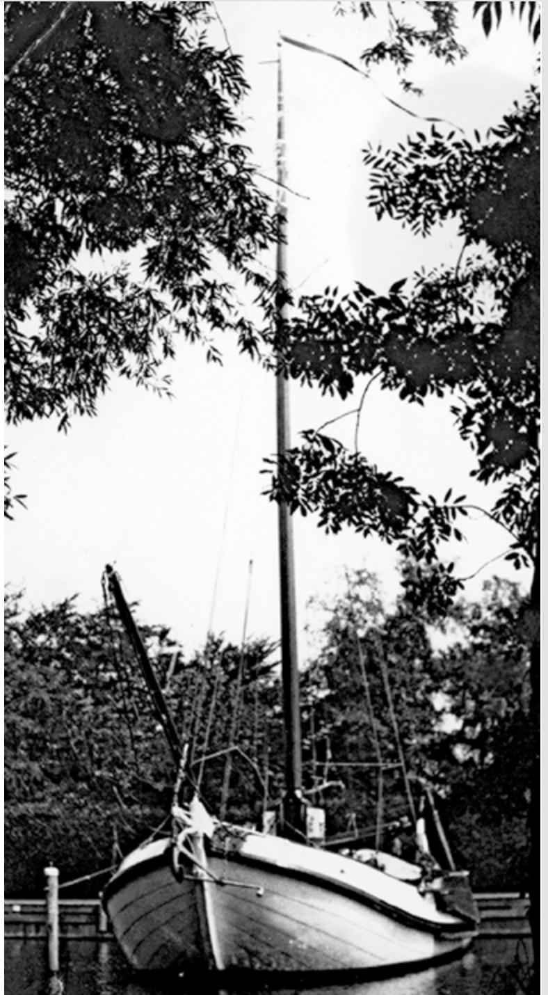
Vor dem Auslaufen

Wie jede Blüte welkt und jede Jugend Dem Alter weicht, blüht jede Lebensstufe, Blüht jede Weisheit auch und jede Tugend Zu ihrer Zeit und darf nicht ewig dauern. Es muss das Herz bei jedem Lebensrufe Bereit zum Abschied sein und Neubeginne, Um sich in Tapferkeit und ohne Trauern In andre, neue Bindungen zu geben. Und jedem Anfang wohnt ein Zauber inne, Der uns beschützt und der uns hilft, zu leben. Wir sollen heiter Raum um Raum durchschreiten, An keinem wie an einer Heimat hängen, Der Weltgeist will nicht fesseln uns und engen, Er will uns Stuf' um Stufe heben, weiten. Kaum sind wir heimisch einem Lebenskreise Und traulich eingewohnt, so droht Erschlaffen, Nur wer bereit zu Aufbruch ist und Reise, Mag lähmender Gewöhnung sich entrafen. Es wird vielleicht auch noch die Todesstunde Uns neuen Räumen jung entgegen senden, Des Lebens Ruf an uns wird niemals enden ... Wohlan denn, Herz, nimm Abschied und gesunde! Hermann Hesse