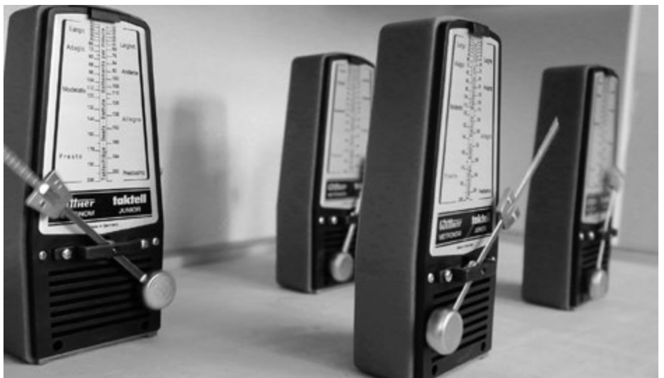
Synchronisierung der Zeit

Ich weiss nicht, wie lange ich dieses Metronomen-Quintett im Gleichschritt beeindruckt angeschaut hatte. Doch der Gleichschritt erinnerte mich zunehmend an eine vorbeimarschierende Truppe – daher stellte ich eines nach dem anderen wieder ab. Aber die faszinierende Beobachtung