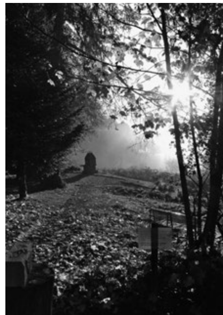
Blick ins Licht

In der letzten Zeit eines Menschen findet eine Reduktion auf das Wesentliche statt. Es kann zum Beispiel sein, dass dem betreffenden Menschen etwas, das lange sehr wichtig war, auf einmal nicht mehr wichtig ist – zum Beispiel «schön sein». Es können auch schwierige innere Prozesse