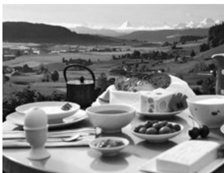
Brunch auf der Terrasse

Wenn Sie schon am Morgen auf der Terrasse sitzen und einen Kaffee geniessen, verwöhnt Sie unser herrliches Bergpanorama mit einem wunderschönen Sonnenaufgang über den Bergen von Grindelwald. Am Sonntag können Sie den Tag mit unserem feinen Rütthubel-Brunch starten – bei schönem Wetter wenn möglich auf der Terrasse! Für das Mittagessen bietet Ihnen unsere grosse Sonnenstore auf der Terrasse den nötigen Schutz vor der Hitze und der Genuss unseres hausgemachten Eistees kühlt von innen. Auch kulinarisch gibt's Sommerliches ... sei es ein würziges Tartar oder ein Salat begleitet von einem saftigen Stück Fleisch oder einem gesunden Stück Gemüsekuchen.