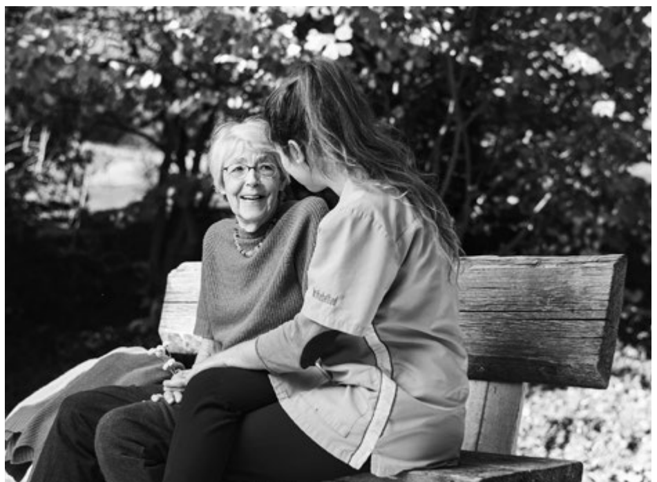
Gespräch auf der Bank

Der ganze Körper beruht auf Rhythmen. Werden diese unterstützt und normalisiert, verstärkt das die Selbstheilungskräfte. Zudem geht es bei den rhythmischen Einreibungen darum, den Wärmeorganismus im Körper anzuregen. Dabei wird durch Berührung die Wärme im Körper ausgeglichen. Bei den rhythmischen Bewegungen wird ein Öl eingerieben, das eine Heilpflanze oder ein heilendes Metall enthält. Es kann auch mit Salben gearbeitet werden. Zusammen mit der zwischenmenschlichen Beziehung und der Aufmerksamkeit, welche der behandelte Mensch dabei erhält, ist das eine sehr wirksame Behandlungsmethode.