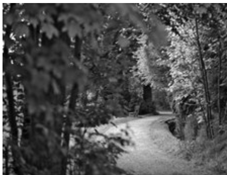
Novalisallee, der Weg zur Kneipp-Anlage

Der Nachmittag lädt wieder ein, eine Pause auf der Terrasse zu geniessen. In unserer Kuchenvitrine finden Sie ein