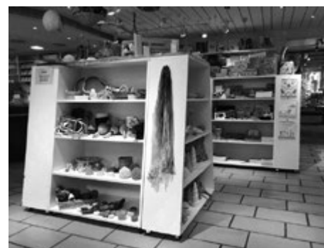
Ein Teil des Angebots im Lade-Kafi

Wir wünschen uns, dass Sie die Zeit bei uns geniessen können und gestärkt und voll frischer Energie wieder in den Alltag zurückkehren. Und wenn der Alltag Teil Ihres Besuches bei uns ist, sind wir überzeugt, dass Ihnen dieser bei uns etwas leichter fällt.