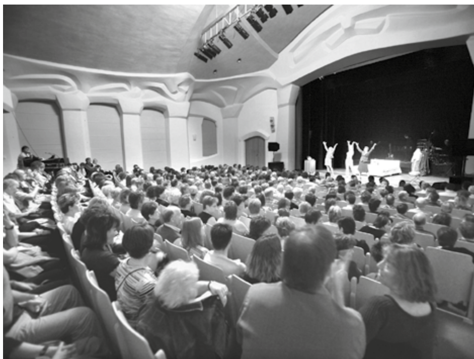
Aufführung im Konzertsaal

Die Kultur im Rütthubelbad nutzt also die knapp gewordenen Finanzen für einen Aufbruch zu neuen, faszinierenden Ufern.