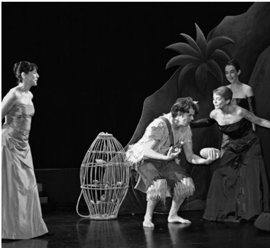
Inszenierung der Zauberflöte, 2006

Als der Knabe vier Jahre alt war, trennten sich die Eltern und er zog mit seiner Mutter, seinem Stiefvater und zwei Stiefbrüdern, einer davon seelenpflegebedürftig, in die Vorstadt. Durch die Begegnung mit diesem Stiefbruder, der schon bald im Zonnehuis, Bernard Lievegoeds Heilpädagogischem Heim Aufnahme fand, kam er früh in Kontakt mit der Anthroposophie. Vor dem Abschluss des Gymnasiums durchlebte er eine Sinnkrise. Er beschäftigte sich intensiv mit den Gesellschaftsmo-