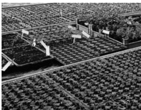
Jungpflanzen im Gewächshaus

Salbei, Ysop, Goldmelissen, Zitronenthymian, Zitronenmelisse sowie rund 12 Minzensorten sind Dauerkulturen. Sie überwintern im Freien und bestehen mehrere Jahre. Insgesamt werden 40 Sorten Kräuter kultiviert und ungefähr 10 Sorten Wildkräuter wie zum Beispiel Brennesseln, Mädesüss, Spitzwegerich, Holunderblüten, Erdbeerbätter, aber auch Malven und Kamille gesammelt. Mit der Ernte der Wildkräuter kann bereits Ende April begonnen werden. Die Kulturkräuter sind ab Ende Juni bis Oktober erntereif. Geerntet wird vormittags, nachdem der Morgentau getrocknet ist. Zu dieser Zeit sind die Aromastoffe am stärksten, gegen Mittag verflüchtigen sie sich.