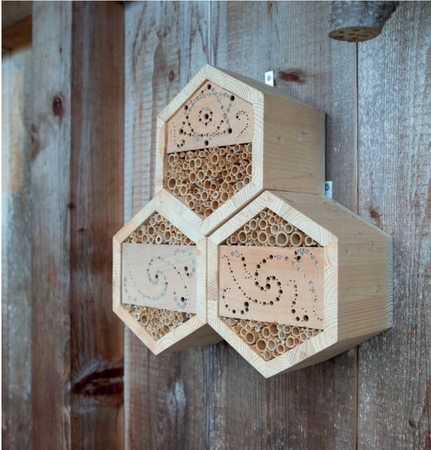
Bewohntes Insektenhotel im Rütthubelbad. Hier wurden drei Zellen zusammengesetzt.

des Leims geprüft. Es sind verschiedene Insektenhotels auf dem Gelände des Rütthubelbad aufgehängt. Man beobachtet sie, um dann noch genauere Angaben zum idealen Standort und zur Wetterfestigkeit machen zu können. Am beliebtesten scheint im Moment der Standort hinten in der Gärtnerei im Rütthubelbad zu sein. Dieses Insektenhotel war innerhalb eines Monats schon halb voll. Und das, obwohl beim Aufhängen die Saison für die Wildbienen bereits vorbei war – sie dauert von Ende Februar bis Ende Juni.