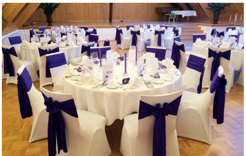
Schön gedeckte Tische im Walkringersaal