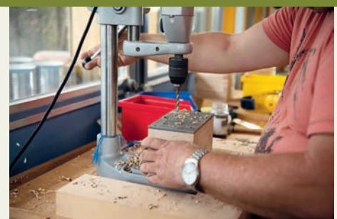
Die Löcher im zentralen Holzblock werden mit Hilfe einer Metallschablone gebohrt