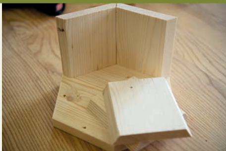
Die äussere Hülle des sechseckigen Insektenhotels – sie wird geleimt

Die Sozialtherapeutische Gemeinschaft im Rütthubelbad legt viel Wert auf Individualität und es ist auch Raum da, um auf Befindlichkeiten und unterschiedliche Arbeitsrhythmen einzugehen. Die Werkgemeinschaft mit ihrem rhythmisch geordneten Tages- und Wochenablauf ist dabei sehr wichtig – sie gibt den Menschen Halt und Sicherheit.