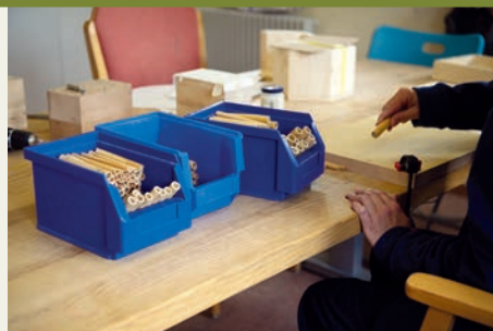
Die obere Kante der Bambusröhrchen wird sorgfältig geschliffen, damit die Insekten sich nicht verletzen