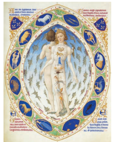
Mikrokosmos Mensch: «Vom Kopf [Widder] bis zum Fuss [Fische] bin ich Gottes Bild...» – Der Homo signorum aus dem Stundenbuch des Herzogs von Berry, Anfang 15. Jahrhundert.

Aber zum Grundproblem: Ein italienischer Professor forscht daran, Köpfe von Menschen zu transplantieren. Möchtest