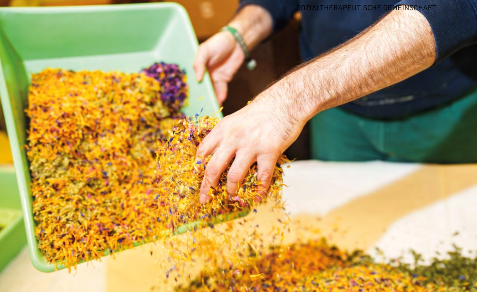
In der Kräuterwerkstatt mischt Roger getrocknete Blätter, umgeben von Gefässen voller farbiger Kräuter für die Teemischungen.

stehen mehrere Behälter mit duftenden Inhalten. Gemäss einem Mischblatt – einer Art Rezept – werden die Sorten zusammengeschüttet und von Hand immer wieder vermengt bis sich Farben und Formen gleichmässig verteilen. Rogers Hände tauchen in die lockere, raschelnde Masse ein. Sein Blick kontrolliert, ob alle Blütenblätter gut gemischt sind.